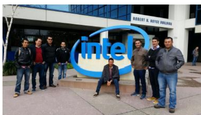
Misión académica Silicón Valley Estados Unidos

En el año 2016 hubo 53 capacitaciones de estudiantes de pregrado y posgrado quienes participaron en cursos, seminarios, talleres, y jornadas académicas en el exterior y también hubo 24 capacitaciones a docentes quienes participaron en giras académicas, estancias doctorales y cursos cortos con la universidad de California - Berkeley, Universidad Santiago de Compostela, UFAM e INPA de Brasil, Universidad Nacional del Litoral, Universidad Nacional de Córdoba, Universidad Nacional de Lanús, Universidad de Varsovia, Universidad de Granada, Universidad de Varsovia, y Gira Académica Caballo de Cocha, Perú.