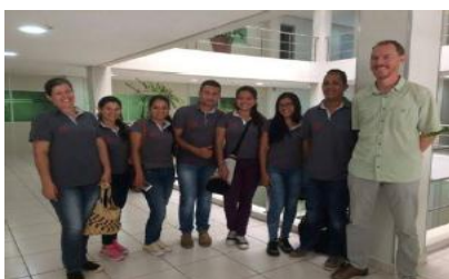
Misión académica UFAM Brasil