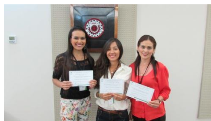
XII Simposio Internacional de Biotecnología Vegetal (Cuba)